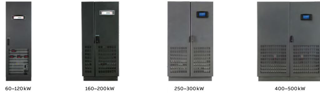
60–120kW 160–200kW 250–300kW 400–500kW

02 Wenn Ihre Leistungsanforderungen wachsen, wächst das USV-System mit – dank seiner Skalierbarkeit – auch bei äußerst beengten Raumverhältnissen.